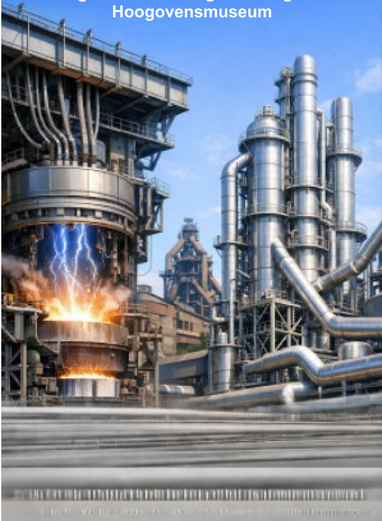
Afbeelding; AI gegenereerd